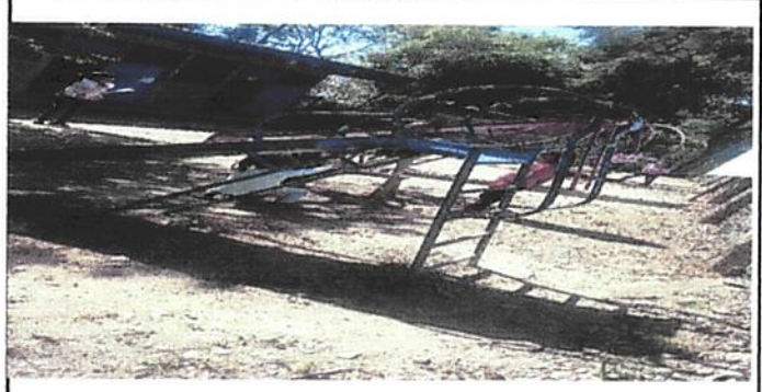
Foto 4. como se puede observar la cocina no cuenta con torta de cemento