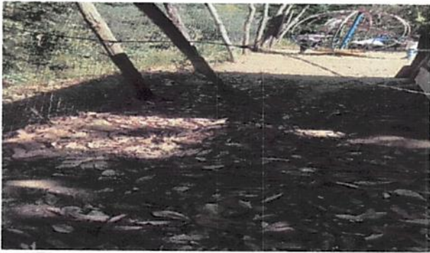
Foto 3. serco de maya galvanizado en mal estado