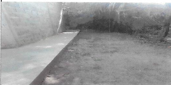
Foto 5. las aulas no cuentan con cunetas o drenajes para agua pluvial