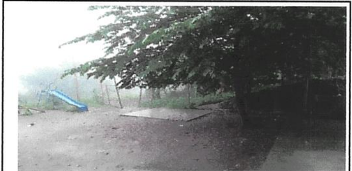
Foto lamina con fuga por deterioro

Observación: Si es necesario se pueden agregar hojas adicionales y actualizar el número de hojas.