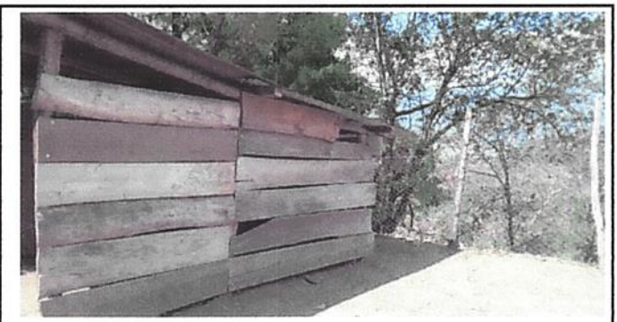
Foto lamina con fuga por deterioro

Observación: Si es necesario se pueden agregar hojas adicionales y actualizar el número de hojas.