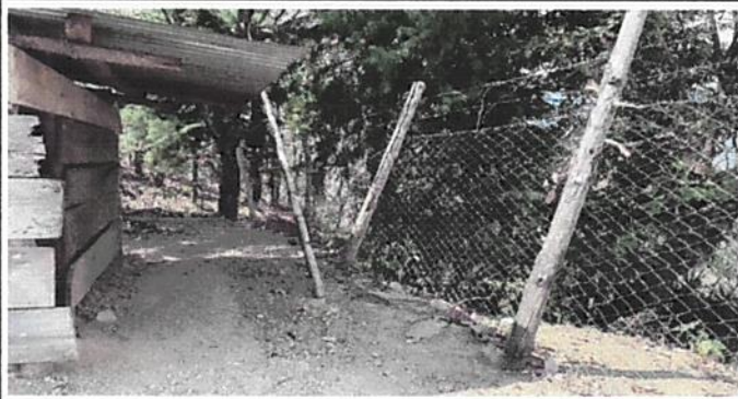
Foto 3. serco de maya galvanizado en mal estado