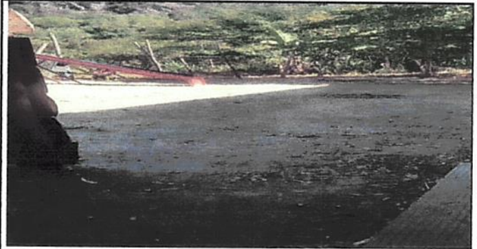
Foto 2. porton de maya galvanizada en mal estado