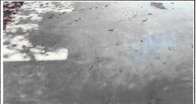
Foto 4. como se puede observar la torta de la cocina se encuentra en mal estado