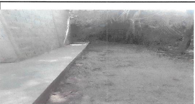
Foto 5. las aulas no cuentan con cunetas o drenajes para agua pluvial